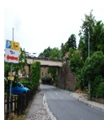
Fotonummer F 09306154 E Aufnahmejahr 2015 Beschreibung Eisenbahnviadukt