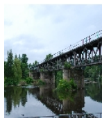
Fotonummer F 09306154 A Aufnahmejahr 2015 Beschreibung Eisenbahnviadukt