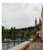
Fotonummer F 09306154 C Aufnahmejahr 2015 Beschreibung Eisenbahnviadukt