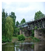
Fotonummer F 09306154 B Aufnahmejahr 2015 Beschreibung Eisenbahnviadukt