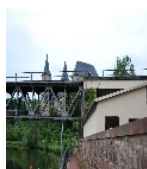
Fotonummer F 09306154 D Aufnahmejahr 2015 Beschreibung Eisenbahnviadukt