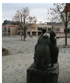
Fotonummer F 09303259 C Aufnahmejahr 2010 Beschreibung Klatschtanten