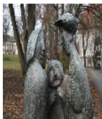
Fotonummer F 09303259 B Aufnahmejahr 2010 Beschreibung Klatschtanten