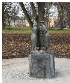
Fotonummer F 09303259 A Aufnahmejahr 2010 Beschreibung Klatschtanten