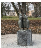
Fotonummer F 09303259 A Aufnahmejahr 2010 Beschreibung Klatschtanten