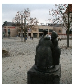
Fotonummer F 09303259 C Aufnahmejahr 2010 Beschreibung Klatschtanten