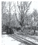
Fotonummer DF 721 955 Aufnahmejahr 1999 Beschreibung Schloßpark, Park

Ausweisungsstelle Landesamt für Denkmalpflege Sachsen