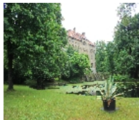
Fotonummer F 09301961 A Aufnahmejahr 2012 Beschreibung Sachgesamtheit Rittergut, Schloss und Schlosspark Seifersdorf mit folgenden Einzeldenkmalen: Schloss (heute Gemeindeverwaltung), Schlossbrücke, Teich und Wassergraben mit Stützmauer, Grotte der Familie Young und Einfriedungsmauer der Parkanlage mit zwei Toranlagen, sowie Herrenhaus, Gutscheune, zwei Wirtschaftsgebäude und Einfriedungsmauer des ehem. Rittergutes (siehe Einzeldenkmalliste - obj. 09283809, gleiche Anschrift), Gärtnerhaus (siehe Einzeldenkmalliste - obj. 09283821), der Schlosspark, nordöstliche Lindenallee und Bereich des ehem. Küchengartens nördlich des Ritterguts (Gartendenkmale) sowie der Wirtschaftshof des Rittergutes als Sachgesamtheitsteil