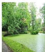
Fotonummer F 09301961 B Aufnahmejahr 2012 Fotograf Machold, Bärbel Beschreibung Sachgesamtheit Rittergut, Schloss und Schlosspark Seifersdorf mit folgenden Einzeldenkmalen: Schloss (heute Gemeindeverwaltung), Schlossbrücke, Teich und Wassergraben mit Stützmauer, Grotte der Familie Young und Einfriedungsmauer der Parkanlage mit zwei Toranlagen, sowie Herrenhaus, Gutscheune, zwei Wirtschaftsgebäude und Einfriedungsmauer des ehem. Rittergutes (siehe Einzeldenkmalliste - obj. 09283809, gleiche Anschrift), Gärtnerhaus (siehe Einzeldenkmalliste - obj. 09283821), der