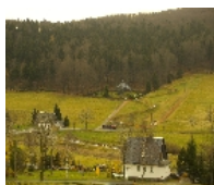
Fotonummer F 09277806 D Aufnahmejahr 2006 Beschreibung Friedhof

Ausweisungsstelle Landesamt für Denkmalpflege Sachsen