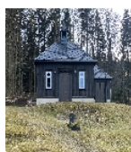
Fotonummer F 09277806 B Aufnahmejahr 2025 Beschreibung Ansicht von Nordost