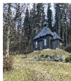
Fotonummer F 09277806 A Aufnahmejahr 2025 Beschreibung Ansicht von Nord