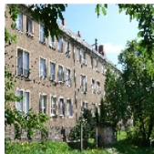
Fotonummer F 09301036 A Aufnahmejahr 2007 Beschreibung Wohnblock - Gartenansicht