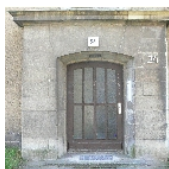
Fotonummer F 09301036 D Aufnahmejahr 2007 Beschreibung Wohnblock - Hauseingang Nr. 24