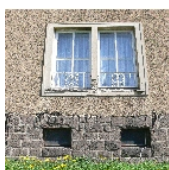
Fotonummer F 09301036 G Aufnahmejahr 2007 Beschreibung Wohnblock - Fenster Gartentrafseite