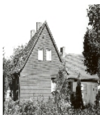
Fotonummer Aufnahmejahr Fotograf Beschreibung

1992 Ahlers, Henrik Doppelwohnhaus mit Anbau über Eck, vermutlich der Firma Christoph & Unmack für Holz-Fertigteilhäuser in Niesky