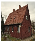
Fotonummer Aufnahmejahr Fotograf Beschreibung

2019 Wappler, Astrid Doppelwohnhaus mit Anbau über Eck, Ansicht von Westen