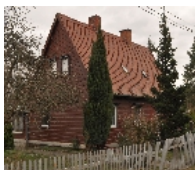
Fotonummer Aufnahmejahr Fotograf Beschreibung

2006 Nitschke, K. Doppelwohnhaus mit Anbau über Eck, vermutlich der Firma Christoph & Unmack für Holz-Fertigteilhäuser in Niesky