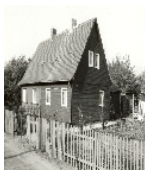
Fotonummer Aufnahmejahr Fotograf Beschreibung