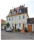
Fotonummer F 09296747 A Aufnahmejahr 2014 Beschreibung Dreifachwohnhaus