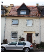
Fotonummer F 09296747 C Aufnahmejahr 2014 Beschreibung Dreifachwohnhaus; Straßenfront Nr. 24