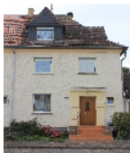
Fotonummer F 09296747 B Aufnahmejahr 2014 Beschreibung Dreifachwohnhaus; Straßenfront Nr. 22