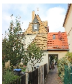
Fotonummer F 09296747 E Aufnahmejahr 2014 Beschreibung Dreifachwohnhaus; südliche Seite Nr. 26 mit Verbindungsbau zu Nr. 28 mit Durchgang