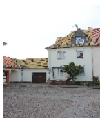
Fotonummer F 09296747 D Aufnahmejahr 2014 Beschreibung Dreifachwohnhaus; Straßenfront Nr. 26