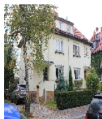
Fotonummer F 09296672 B Aufnahmejahr 2014 Beschreibung Doppelwohnhaus; Ansicht mit Nr. 17 im Vordergrund