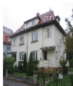
Fotonummer F 09296672 A Aufnahmejahr 2014 Beschreibung Doppelwohnhaus