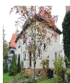
Fotonummer F 09296672 E Aufnahmejahr 2014 Beschreibung Doppelwohnhaus; Ansicht südliche Seite Nr. 19