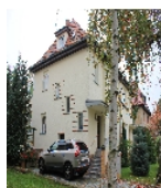
Fotonummer F 09296672 C Aufnahmejahr 2014 Beschreibung Doppelwohnhaus; Ansicht nördliche Seite Nr. 17