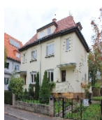
Fotonummer F 09296672 D Aufnahmejahr 2014 Beschreibung Doppelwohnhaus; Ansicht mit Nr. 19 im Vordergrund