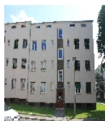
Fotonummer F 09296619 B Aufnahmejahr 2013 Beschreibung Mietshauszeile; Ansicht Nr. 13