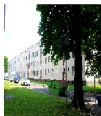
Fotonummer F 09296619 A Aufnahmejahr 2013 Beschreibung Mietshauszeile