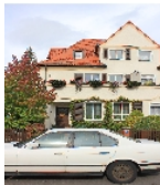
Fotonummer F 09296189 C Aufnahmejahr 2014 Beschreibung Doppelwohnhaus; Straßenfront Nr. 13