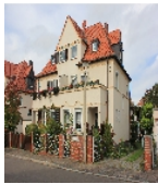
Fotonummer F 09296189 A Aufnahmejahr 2014 Beschreibung Doppelwohnhaus