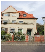
Fotonummer F 09296189 B Aufnahmejahr 2014 Beschreibung Doppelwohnhaus; Straßenfront Nr. 15