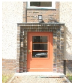
Fotonummer F 09296069 C Aufnahmejahr 2013 Beschreibung Mietshauszeile; Detailansicht Hauseingang Nr. 2