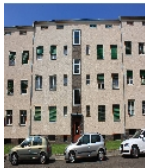
Fotonummer F 09296069 B Aufnahmejahr 2013 Beschreibung Mietshauszeile; Ansicht Nr. 4