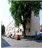
Fotonummer F 09296069 A Aufnahmejahr 2013 Beschreibung Mietshauszeile