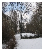
Fotonummer F 09293029 A Aufnahmejahr 2013 Beschreibung Schmuckplatz

Ausweisungsstelle Landesamt für Denkmalpflege Sachsen