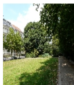
Fotonummer F 09293029 D Aufnahmejahr 2013 Beschreibung Staudenbeet im nördlichen Teil des Floßplatzes und Begrenzungsmauer (rechts) von der Umgestaltung um 1960; als Läuferstreifen entlang der Bordeinfassung der Rasenfläche Beton-Mosaikpflaster-Platten