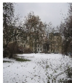
Fotonummer F 09293029 B Aufnahmejahr 2013 Beschreibung Schmuckplatz