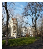
Fotonummer F 09293029 E Aufnahmejahr 2014 Beschreibung Südlicher Abschnitt des Floßplatzes mit einzelnen Altexemplaren des Götterbaums als Relikte der ursprünglichen Gestaltung