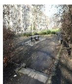
Fotonummer F 09293029 F Aufnahmejahr 2014 Beschreibung Platzsituation zwischen den beiden Teilflächen des Floßplatzes (nördlich Hohe Straße)