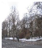
Fotonummer F 09293029 C Aufnahmejahr 2013 Beschreibung Schmuckplatz