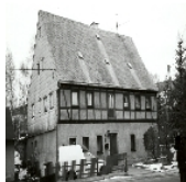
Fotonummer LVII/36/19 Aufnahmejahr 1997 Beschreibung Ländliches Wohnhaus (OG Fachwerk)