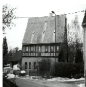
Fotonummer LVII/36/20 Aufnahmejahr 1997 Beschreibung Ländliches Wohnhaus (OG Fachwerk)