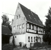
Fotonummer CIII/41/12 Aufnahmejahr Fotograf Beschreibung