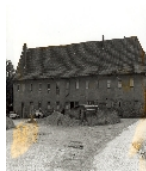
Fotonummer LXXVII/88/12A Aufnahmejahr 1999 Beschreibung Gutsbrauerei