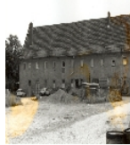
Fotonummer LXXVII/88/11A Aufnahmejahr 1999 Beschreibung Brauereigebäude