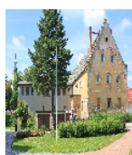
Fotonummer F 09278828 B Aufnahmejahr 2012 Beschreibung Brauhaus (zwei Anschriften: Lungkwitzer Straße 5 und Dresdner Straße 8)