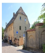
Fotonummer F 09278828 A Aufnahmejahr 2012 Beschreibung Brauhaus (zwei Anschriften: Lungkwitzer Straße 5 und Dresdner Straße 8)