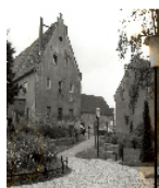
Fotonummer LXXVII/88/25A Aufnahmejahr 1999 Beschreibung Brauereigebäude