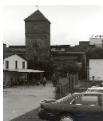
Fotonummer XXXIX/66/18 Aufnahmejahr Fotograf Beschreibung