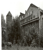
Fotonummer XXXIX/66/17 Aufnahmejahr Fotograf Beschreibung