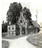
Fotonummer LXVIII/87/29 Aufnahmejahr 1998 Beschreibung Gutshof