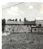
Fotonummer LXVIII/87/31 Aufnahmejahr 1998 Beschreibung Gutshof