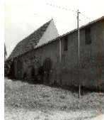
Fotonummer LXVIII/87/30 Aufnahmejahr 1998 Beschreibung Gutshof