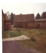
Fotonummer LXIV/65/6 Aufnahmejahr 1998 Beschreibung Gutshof