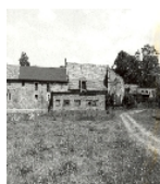
Fotonummer LXVIII/87/32 Aufnahmejahr 1998 Beschreibung Gutshof