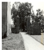
Fotonummer LXVIII/87/28 Aufnahmejahr 1998 Beschreibung Gutshof