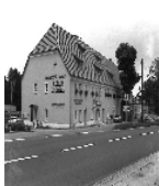
Fotonummer LXXIII/65/2 Aufnahmejahr Fotograf Beschreibung