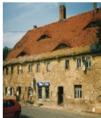
Fotonummer F 09269666 B Aufnahmejahr 1997 Beschreibung Gasthof