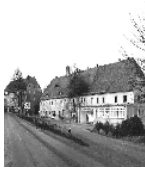
Fotonummer DF 409 931 Aufnahmejahr Fotograf Beschreibung