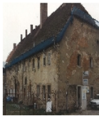
Fotonummer LXIV/65/19 Aufnahmejahr Fotograf Beschreibung