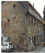
Fotonummer LXIV/65/18 Aufnahmejahr Fotograf Beschreibung