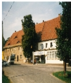
Fotonummer F 09269666 A Aufnahmejahr 1997 Beschreibung Gasthof