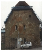
Fotonummer LXIV/65/17 Aufnahmejahr Fotograf Beschreibung