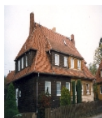
Fotonummer LXXV/100/11A Aufnahmejahr Fotograf Beschreibung Doppelwohnhaus, Firma Christoph und Unmack für Holz-Fertigteilhäuser in Niesky