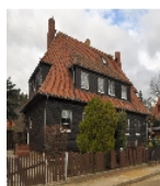
Fotonummer F 09269497 B Aufnahmejahr 2019 Beschreibung Doppelwohnhaus der Firma Christoph und Unmack für Holz-Fertigteilhäuser in Niesky, baugeschichtlich von Bedeutung, Ostansicht