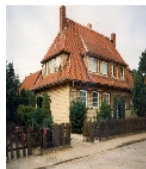
Fotonummer XLVIII/76/0 Aufnahmejahr Fotograf Beschreibung