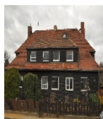
Fotonummer F 09269497 A Aufnahmejahr 2019 Beschreibung Doppelwohnhaus der Firma Christoph und Unmack für Holz-Fertigteilhäuser in Niesky, baugeschichtlich von Bedeutung, Ostansicht