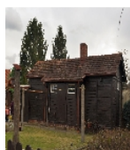
Fotonummer F 09269395 B Aufnahmejahr 2019 Beschreibung Doppelwohnhaus, Schuppen