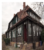
Fotonummer F 09269395 A Aufnahmejahr 2019 Beschreibung Doppelwohnhaus und Schuppen, Ansicht von Norden