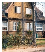
Fotonummer XLVIII/78/1 Aufnahmejahr Fotograf Beschreibung Doppelwohnhaus und Schuppen