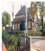
Fotonummer XLVIII/78/0 Aufnahmejahr Fotograf Beschreibung