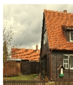
Fotonummer F 09269372 B Aufnahmejahr 2019 Beschreibung Dreifachwohnhaus mit Schuppen, Ansicht von Westen, Schuppen