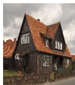
Fotonummer F 09269372 A Aufnahmejahr 2019 Beschreibung Dreifachwohnhaus mit Schuppen, Ansicht von Westen