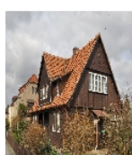
Fotonummer F 09269372 D Aufnahmejahr 2019 Beschreibung Dreifachwohnhaus mit Schuppen, Ansicht von Osten