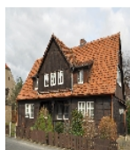
Fotonummer F 09269372 C Aufnahmejahr 2019 Beschreibung Dreifachwohnhaus mit Schuppen, Ansicht von Süden