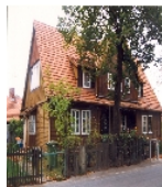
Fotonummer LXXI/19/25 Aufnahmejahr Fotograf Beschreibung