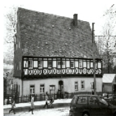
Fotonummer LVII/36/7 Aufnahmejahr 1997 Beschreibung Pfarrhaus