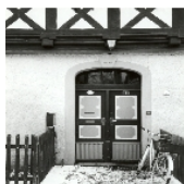
Fotonummer LVII/36/6 Aufnahmejahr 1997 Fotograf Fleischer Beschreibung Pfarrhaus, Haustür