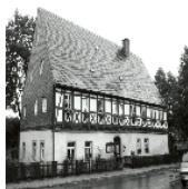
Fotonummer CIII/39/28 Aufnahmejahr Fotograf Beschreibung