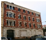
Fotonummer F 09264758 A Aufnahmejahr 2011 Beschreibung Mietshaus