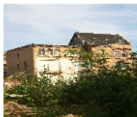
Fotonummer F 09264758 C Aufnahmejahr 2011 Beschreibung Fabrikgebäude im Hof; Ansicht von der Holzhäuser Straße