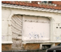
Fotonummer F 09264758 B Aufnahmejahr 2011 Beschreibung Mietshaus; Laden