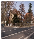
Fotonummer F 09263187 E Aufnahmejahr 2012 Beschreibung Gesamtansicht Villa mit Garten, Zaun und Solitärbaum (Schwarzkiefer) von SO