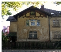
Fotonummer F 09263187 C Aufnahmejahr 2011 Beschreibung Mietvilla