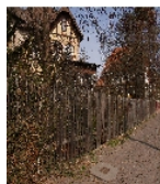
Fotonummer F 09263187 F Aufnahmejahr 2012 Beschreibung Einfriedung an der Ludolf-Colditz-Straße von SW