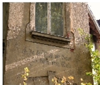
Fotonummer F 09263187 D Aufnahmejahr 2011 Beschreibung Mietvilla; Detail am Eckerker