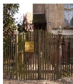
Fotonummer F 09263187 G Aufnahmejahr 2012 Beschreibung Pforte von NW