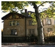
Fotonummer F 09263187 B Aufnahmejahr 2011 Beschreibung Mietvilla

Ausweisungsstelle Landesamt für Denkmalpflege Sachsen