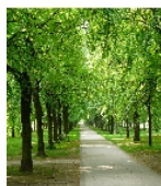
Fotonummer F 09262765 D Aufnahmejahr 2014 Beschreibung Sicht durch die Allee nach Süden