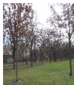
Fotonummer F 09262765 C Aufnahmejahr 2013 Beschreibung Allee