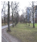
Fotonummer F 09262765 B Aufnahmejahr 2013 Beschreibung Allee