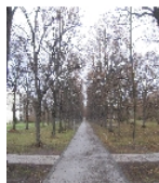
Fotonummer F 09262765 A Aufnahmejahr 2013 Beschreibung Allee

Ausweisungsstelle Landesamt für Denkmalpflege Sachsen