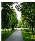
Fotonummer F 09262765 E Aufnahmejahr 2014 Beschreibung südliches Ende der Allee mit ursprünglicher Orientierung auf die Villa Sack (heute Robert-Koch-Park)