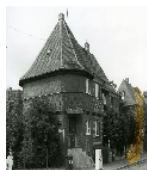
Fotonummer LV/43/3 Aufnahmejahr 1996 Beschreibung Reihenhäuser Nr. 105, 107, 109, 111 einer Wohnsiedlung