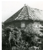
Fotonummer LV/43/1 Aufnahmejahr 1996 Beschreibung Reihnhaus Nr. 103 einer Wohnsiedlung