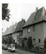
Fotonummer LV/43/5 Aufnahmejahr 1996 Beschreibung Reihenhäuser Nr. 118, 116, 114, 112, 110, 108, 106, 104 und Wohnhaus Nr. 102, 100 einer Wohnsiedlung