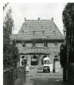
Fotonummer LV/43/2 Aufnahmejahr 1996 Beschreibung Wohnhaus Nr. 94 einer Wohnsiedlung