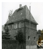
Fotonummer LV/43/4 Aufnahmejahr 1996 Beschreibung Wohnhaus Nr. 96, 98 einer Wohnsiedlung