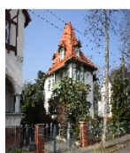
Fotonummer F 09259547 C Aufnahmejahr 2021 Beschreibung Villa