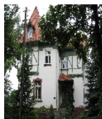
Fotonummer F 09259547 B Aufnahmejahr 2012 Beschreibung Villa