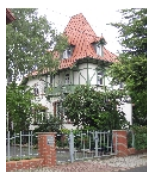
Fotonummer F 09259547 A Aufnahmejahr 2012 Beschreibung Villa