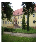
Fotonummer F 09258899 B Aufnahmejahr 2010 Beschreibung Schule, Südflügel