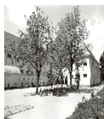
Fotonummer XLIII/56/1 Aufnahmejahr Fotograf Beschreibung