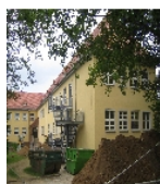
Fotonummer F 09258899 A Aufnahmejahr 2010 Beschreibung Schule, Südflügel