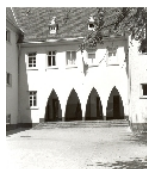
Fotonummer XLIII/56/2 Aufnahmejahr Fotograf Beschreibung