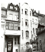
Fotonummer XLIII/47/12 Aufnahmejahr Fotograf Beschreibung