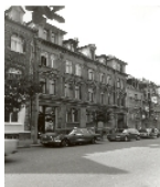
Fotonummer XLIII/47/11 Aufnahmejahr Fotograf Beschreibung