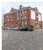
Fotonummer F 09256467 B Aufnahmejahr 2012 Beschreibung Schule