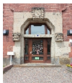
Fotonummer F 09256467 C Aufnahmejahr 2012 Beschreibung Schule, Eingang