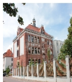
Fotonummer F 09256467 A Aufnahmejahr 2012 Beschreibung Schule

Ausweisungsstelle Landesamt für Denkmalpflege Sachsen