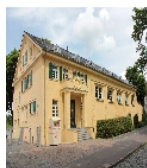
Fotonummer F 09256467 D Aufnahmejahr 2012 Beschreibung Turnhalle