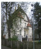
Fotonummer F 09256035 B Aufnahmejahr 2011 Beschreibung Villa