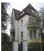
Fotonummer F 09256035 D Aufnahmejahr 2011  Beschreibung Villa