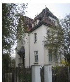
Fotonummer F 09256035 C Aufnahmejahr 2011 Beschreibung Villa