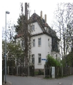
Fotonummer F 09256035 A Aufnahmejahr 2011 Beschreibung Villa

Ausweisungsstelle Landesamt für Denkmalpflege Sachsen