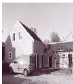
Fotonummer CXXVII/17/29 Aufnahmejahr 2011 Beschreibung links Werkstattgebäuden (ehem. Dreherei) und rechts Schuppen