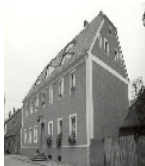
Fotonummer XL/15/2 Aufnahmejahr Fotograf Beschreibung