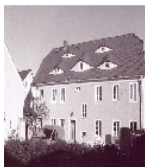
Fotonummer CXXVII/17/28 Aufnahmejahr 2011 Beschreibung Wohnhaus, Rückseite