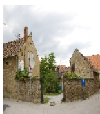
Fotonummer F 09253065 A Aufnahmejahr 2012 Beschreibung links Kutscherwohnung und Stall, mittig rückwärtige ehem. Werkstattgebäude ( Tischlerei, Dreherei, Rohrzieherei sowie Formerei) und Einfahrt