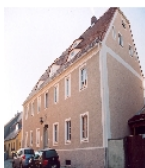
Fotonummer CXXVII/23/15 Aufnahmejahr 2011 Beschreibung Wohnhaus und zwei Werkstattgebäude im Grundstück