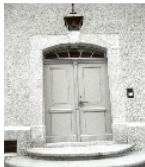
Fotonummer XL/15/3 Aufnahmejahr Fotograf Beschreibung