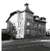
Fotonummer CV/68/9 Aufnahmejahr Fotograf Beschreibung