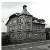
Fotonummer LXIII/49/6 Aufnahmejahr 1997 Beschreibung Wohnhaus