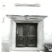
Fotonummer LXIII/49/7 Aufnahmejahr 1997 Beschreibung Wohnhaus, Hauseingang mit Portal