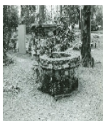
Fotonummer LXVII/19/25 Aufnahmejahr Fotograf Beschreibung

Ausweisungsstelle Landesamt für Denkmalpflege Sachsen