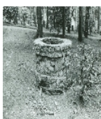
Fotonummer LXVII/19/26 Aufnahmejahr Fotograf Beschreibung