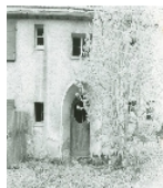
Fotonummer L/23/16 Aufnahmejahr Fotograf Beschreibung