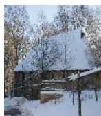
Fotonummer F 09246962 B Aufnahmejahr 2017 Beschreibung Einzeldenkmal in o. g. Sachgesamtheit: Ehemaliges Brauhaus, später Wohnhaus (siehe auch Sachgesamtheitsliste gleiche Anschrift - obj 09246969)