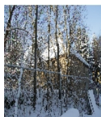
Fotonummer F 09246962 A Aufnahmejahr 2017 Beschreibung Einzeldenkmal in o. g. Sachgesamtheit: Ehemaliges Brauhaus, später Wohnhaus (siehe auch Sachgesamtheitsliste gleiche Anschrift - obj 09246969)