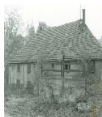
Fotonummer L/23/17 Aufnahmejahr Fotograf Beschreibung