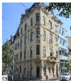
Fotonummer F 09245917 A Aufnahmejahr 2016 Beschreibung Mietshaus in Ecklage in geschlossener Bebauung