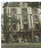
Fotonummer XLI/9/21 Aufnahmejahr Fotograf Beschreibung