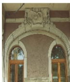
Fotonummer XLI/9/22 Aufnahmejahr Fotograf Beschreibung