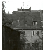
Fotonummer XXXIX/88/2 Aufnahmejahr 1995 Beschreibung Wohnhaus und Hinterhaus, Rückansicht