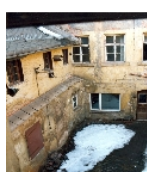
Fotonummer F 09243862 B Aufnahmejahr 1993 Fotograf Beschreibung