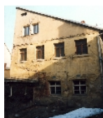
Fotonummer F 09243862 A Aufnahmejahr 1993 Fotograf Beschreibung