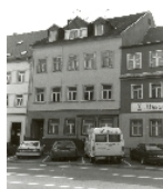
Fotonummer XXXIX/88/6 Aufnahmejahr 1995 Beschreibung Wohnhaus und Hinterhaus