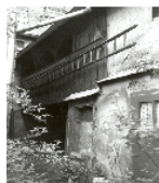
Fotonummer XXXIX/88/3 Aufnahmejahr 1995  Beschreibung Wohnhaus und Hinterhaus, Hofansicht Seitengebäude mit Oberlaube 1995 abgebrochen