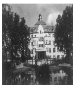
Fotonummer DF 423 136 Aufnahmejahr Fotograf Beschreibung