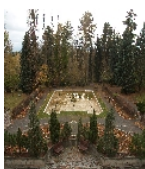
Fotonummer F 09241523 B Aufnahmejahr 2013 Beschreibung Krankenhausgarten mit Bassin; Blick vom Eingang des Krankenhause entlang der Mittelachse nach Südwesten