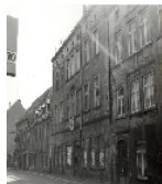
Fotonummer LXIX/62/36 Aufnahmejahr Fotograf Beschreibung