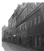
Fotonummer LXIX/62/35 Aufnahmejahr Fotograf Beschreibung