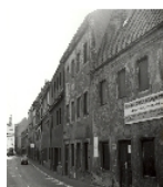
Fotonummer LXIX/62/34 Aufnahmejahr Fotograf Beschreibung