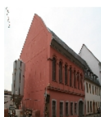
Fotonummer F 09240973 A Aufnahmejahr 2011 Beschreibung Fassade eines ehemaligen Geschäftshauses, ursprünglich mit Laden und Saal im Obergeschoss in geschlossener Bebauung