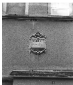
Fotonummer LXIX/60/23 Aufnahmejahr Fotograf Beschreibung