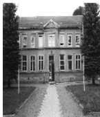
Fotonummer LXIX/60/22 Aufnahmejahr Fotograf Beschreibung