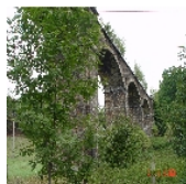
Fotonummer F 09240014 A Aufnahmejahr 2003 Beschreibung Eisenbahnviadukt