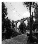
Fotonummer LXIX/54/2 Aufnahmejahr 1998 Beschreibung Eisenbahnviadukt