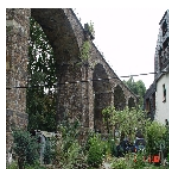
Fotonummer F 09240014 C Aufnahmejahr 2003 Beschreibung Eisenbahnviadukt