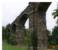
Fotonummer F 09240014 B Aufnahmejahr 2003 Beschreibung Eisenbahnviadukt