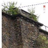
Fotonummer F 09240014 D Aufnahmejahr 2003 Beschreibung Eisenbahnviadukt