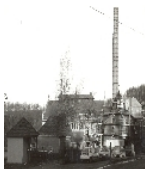
Fotonummer XXXVII/72/25 Aufnahmejahr Fotograf Beschreibung