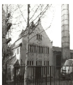
Fotonummer XXXVII/72/27 Aufnahmejahr Fotograf Beschreibung