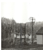
Fotonummer XXXVII/72/26 Aufnahmejahr Fotograf Beschreibung