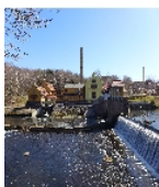
Fotonummer F 09237625 J Aufnahmejahr 2018 Beschreibung Ehemaliges Elektrizitätswerk, Blick aus nordöstlicher Richtung vom linken Ufer der Zschopau aus auf die gegenüberliegenden Anlagen