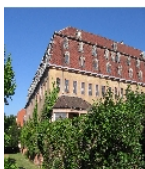
Fotonummer F 09235418 F Aufnahmejahr Fotograf Delang, Steffen Beschreibung Ehemaliges Schloss mit anschließenden Wirtschaftsgebäuden, heute Kinderkrankenhaus