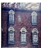
Fotonummer F 09235418 B Aufnahmejahr 1996 Beschreibung Schloss