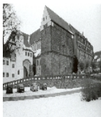
Fotonummer CX/51/1 Aufnahmejahr Fotograf Beschreibung