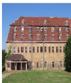
Fotonummer F 09235418 A Aufnahmejahr Beschreibung Ehemaliges Schloss mit anschließenden Wirtschaftsgebäuden, heute Kinderkrankenhaus