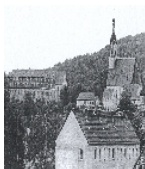
Fotonummer DF 729 237 Aufnahmejahr Fotograf Beschreibung