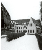
Fotonummer CX/51/2 Aufnahmejahr Fotograf Beschreibung