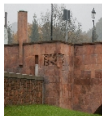
Fotonummer F 09235251 J Aufnahmejahr 2016 Beschreibung Muldenbrücke - Detail am Brückenkopf