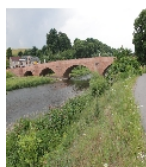
Fotonummer F 09235251 K Aufnahmejahr 2017 Beschreibung Muldenbrücke