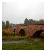
Fotonummer F 09235251 I Aufnahmejahr 2016 Beschreibung Muldenbrücke