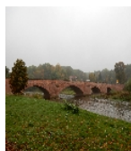
Fotonummer F 09235251 H Aufnahmejahr 2016 Beschreibung Muldenbrücke