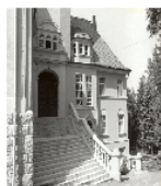
Fotonummer XLII/44/4 Aufnahmejahr Fotograf Beschreibung