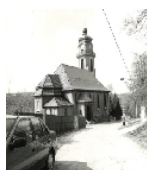
Fotonummer DF 404 440 Aufnahmejahr 1991 Beschreibung Katholische Kirche zum Heiligen Kreuz, Ansicht von SO