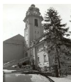
Fotonummer XLII/44/5 Aufnahmejahr Fotograf Beschreibung