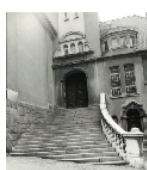
Fotonummer DF 404 442 Aufnahmejahr 1991 Beschreibung Katholische Kirche zum Heiligen Kreuz, Hauptportal