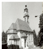
Fotonummer XLII/44/3 Aufnahmejahr Fotograf Beschreibung