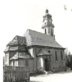
Fotonummer DF 404 441 Aufnahmejahr 1991 Beschreibung Katholische Kirche zum Heiligen Kreuz, Ansicht von SO