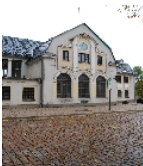
Fotonummer F 09233616 R Aufnahmejahr 2009 Beschreibung Bahnhof Falkenstein; Empfangsgebäude