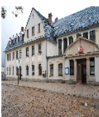
Fotonummer F 09233616 S Aufnahmejahr 2009 Beschreibung Bahnhof Falkenstein; Empfangsgebäude