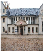
Fotonummer F 09233616 P Aufnahmejahr 2009 Beschreibung Bahnhof Falkenstein; Empfangsgebäude