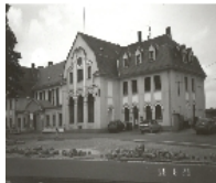
Fotonummer LIV/12/27 Aufnahmejahr Fotograf Beschreibung