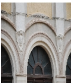
Fotonummer F 09233616 Q Aufnahmejahr 2009 Beschreibung Bahnhof Falkenstein; Empfangsgebäude, Detail