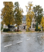
Fotonummer F 09233616 O Aufnahmejahr 2009 Beschreibung Bahnhof Falkenstein; Empfangsgebäude