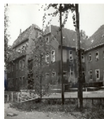
Fotonummer XXVIII/69/25 Aufnahmejahr Fotograf Beschreibung