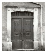
Fotonummer XXVIII/47/74 Aufnahmejahr Fotograf Beschreibung