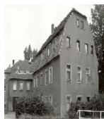
Fotonummer XXVIII/46/1 Aufnahmejahr Fotograf Beschreibung