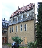
Fotonummer F 09229400 B Aufnahmejahr 2013 Beschreibung Wohnhaus, Hofseite