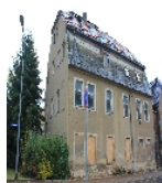
Fotonummer F 09229400 A Aufnahmejahr 2013 Beschreibung Wohnhaus, Front zur Gellertstraße