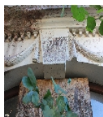
Fotonummer F 09229400 F Aufnahmejahr 2023 Fotograf Beschreibung Wohnhaus, Schlussstein der Haustür