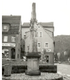
Fotonummer DF 481 273 Aufnahmejahr Fotograf Beschreibung