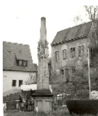
Fotonummer DF 481 274 Aufnahmejahr Fotograf Beschreibung