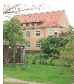
Fotonummer F 09221644 C Aufnahmejahr 2012 Beschreibung Mehrfamilienhaus einer Wohnanlage, Ansicht Gartenseite