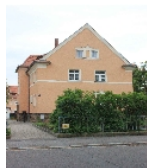
Fotonummer F 09221644 A Aufnahmejahr 2012 Beschreibung Mehrfamilienhaus einer Wohnanlage, Ansicht Eingangsseite