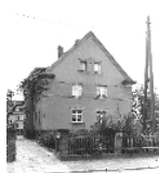
Fotonummer DF 464 996 Aufnahmejahr Fotograf Beschreibung