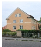
Fotonummer F 09221644 B Aufnahmejahr 2012 Beschreibung Mehrfamilienhaus einer Wohnanlage, Ansicht Straßenseite