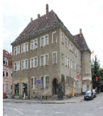
Fotonummer F 09221600 A Aufnahmejahr 2012  Beschreibung Mietshaus in offener Bebauung, mit Post, z.T. originale Ladenfront, Gesamtansicht