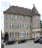
Fotonummer F 09221600 B Aufnahmejahr 2012 Beschreibung Mietshaus in offener Bebauung, mit Post, z.T. originale Ladenfront, Ansicht Front zum Bahnhofsvorplatz