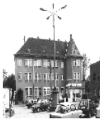
Fotonummer DF 464 929 Aufnahmejahr Fotograf Beschreibung