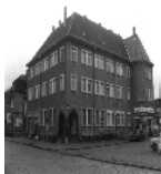
Fotonummer 20 E 1231 Aufnahmejahr Fotograf Beschreibung