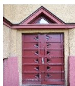
Fotonummer F 09218760 D Aufnahmejahr 2015 Beschreibung Wohnblock, Eingangstür