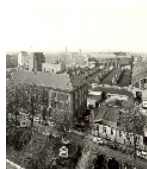
Fotonummer DF 415 671 Aufnahmejahr Fotograf Beschreibung