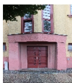
Fotonummer F 09218760 E Aufnahmejahr 2015 Beschreibung Wohnblock, Fassadendetail