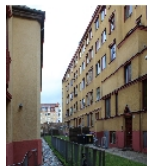
Fotonummer F 09218760 B Aufnahmejahr 2015  Beschreibung Wohnblock, Rückansicht