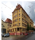
Fotonummer F 09218760 A Aufnahmejahr 2015 Beschreibung Wohnblock