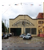
Fotonummer F 09218760 C Aufnahmejahr 2015 Beschreibung Einfahrhalle